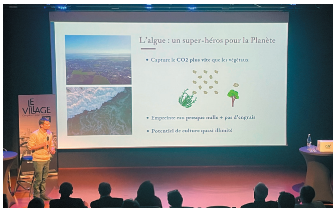
Nicolas Royal, directeur technique de Neptune Elements, est venu présenter l'entreprise pour entrer au Village by CA Flistère.

Neptune Elements est une entreprise qui démocratise les algues dans l'alimentation car ce sont des super aliments pour l'Homme et des super héros pour la Planète.